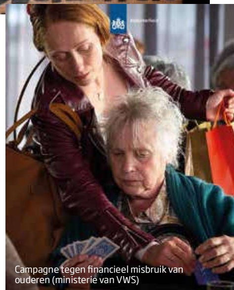
Campagne tegen financieel misbruik van ouderen (ministerie van VWS)

Eenzaamheid is een belangrijke risicofactor. Verreweg de meeste slachtoffers zijn alleenstaande ouderen met fysieke en/of