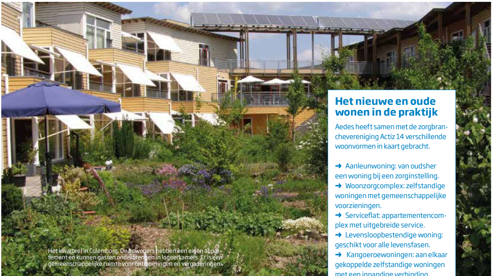
Het kwartel in Culemborg. De bewoners hebben een eigen appartement en kunnen gasten onderbrengen in logeerkamers. Er is een gemeenschappelijke ruimte voor ontmoetingen en vergaderingen.